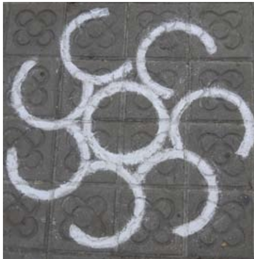
Ensayo, 2016. Con tiza