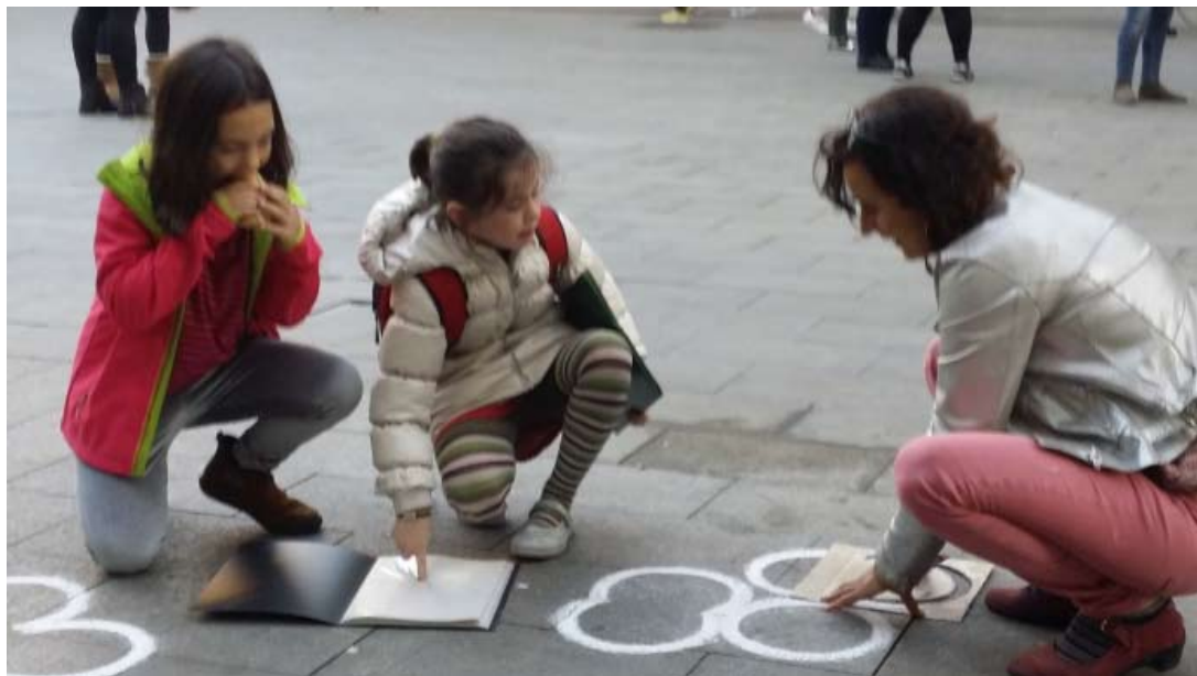
Ensayo participativo 1, 2016. Dibujos con tizas, en el marco de «Cartografías de barrio», Ampa Fort Pienç, participan las escuelas Fort Pienç, Sagrado Corazón, Pau Vila